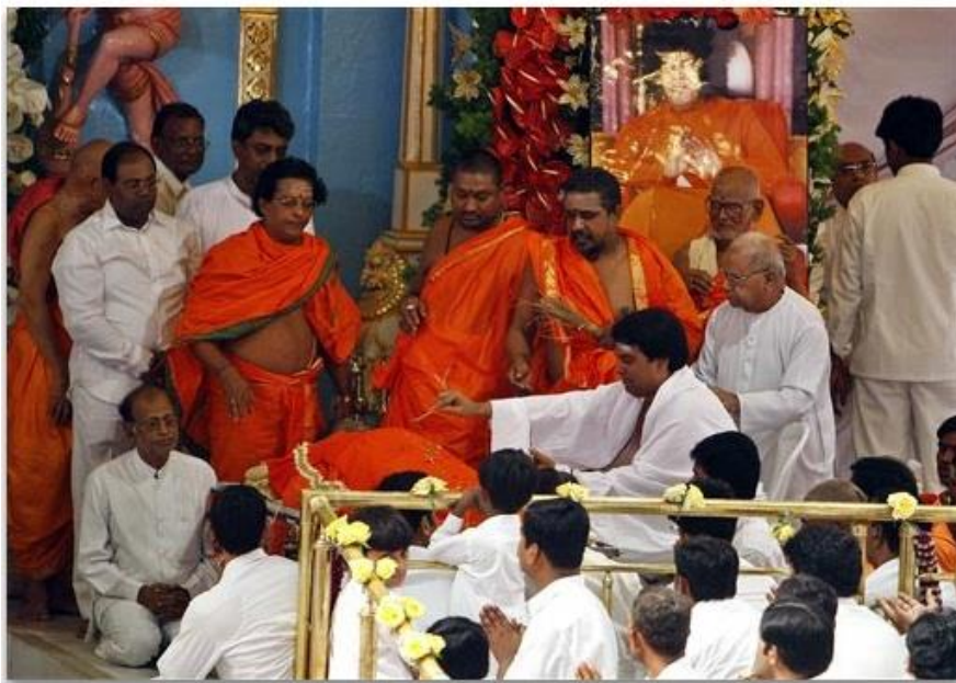
Goldenes Licht kommt von dem Sai Baba Bild waehrend der letzten rites in der Sai Kulwant Hall, Prashanti Nilayam, 27 April 2011 Es schein das Kosmik Sai Baba die Ceremony uebersieht.