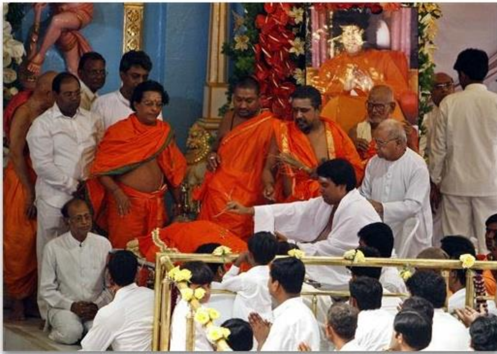
Goldenes Licht aus dem Bild von Sai Baba während der letzten Riten in Sai Kulwant Halle, Prashanti Nilayam, 27 April 2011 - es scheint, Cosmic Sai Baba ist die Überwachung des Verfahrens

"Eine Nachricht wurde von Cosmic Sai Baba erhielt seinen unsterblichen Selbst wieder zu hören, seine Botschaft vom April 5th, 2011"